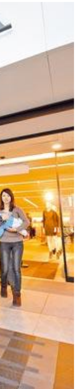
前品牌有 其中台灣 灣區的 有毒。圖 與親友一 東振堂

【侯俐安／台北報導】國際環保團體綠色和平組織昨天在全球同步公布「全球時尚品牌有毒有害物質殘留調查」，在世界各國隨機採購一四一件衣服褲子，竟高達六三%殘留有毒物質壬基酚聚氧乙烯醚（N P E），部分還含有塑化劑與芳香胺。